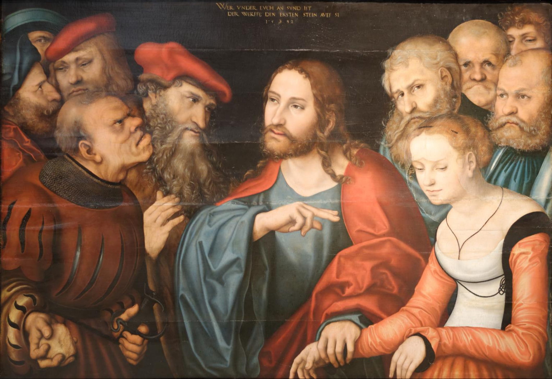
Lucas Cranach, (1472–1553), Le Christ et la femme adultère, 1532, Musée de Budapest