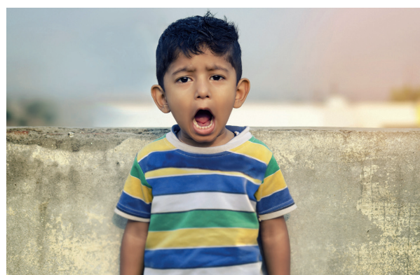
Oreilles débouchées, parole déliée